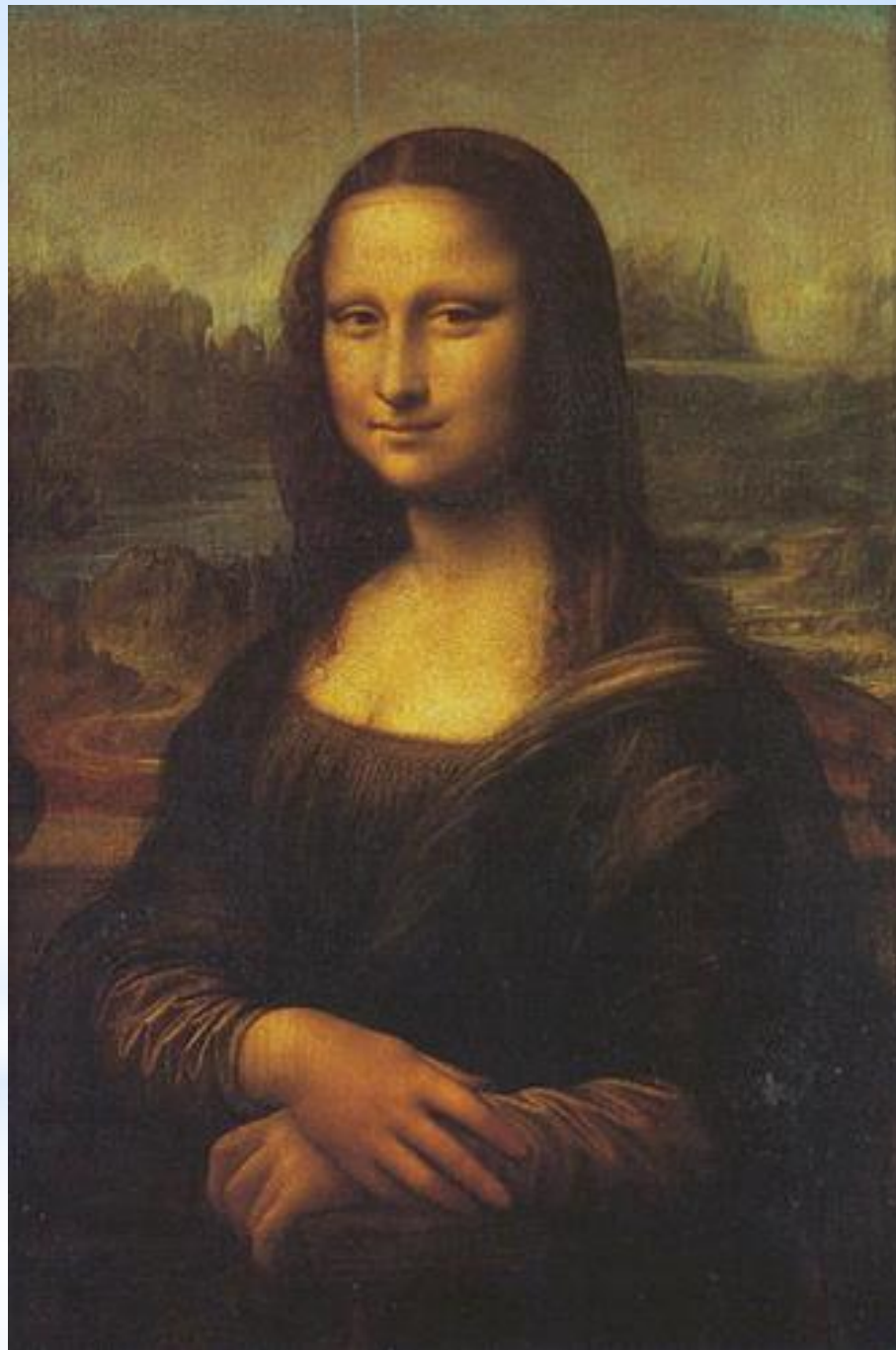
Mona Lisa Louvren Paris