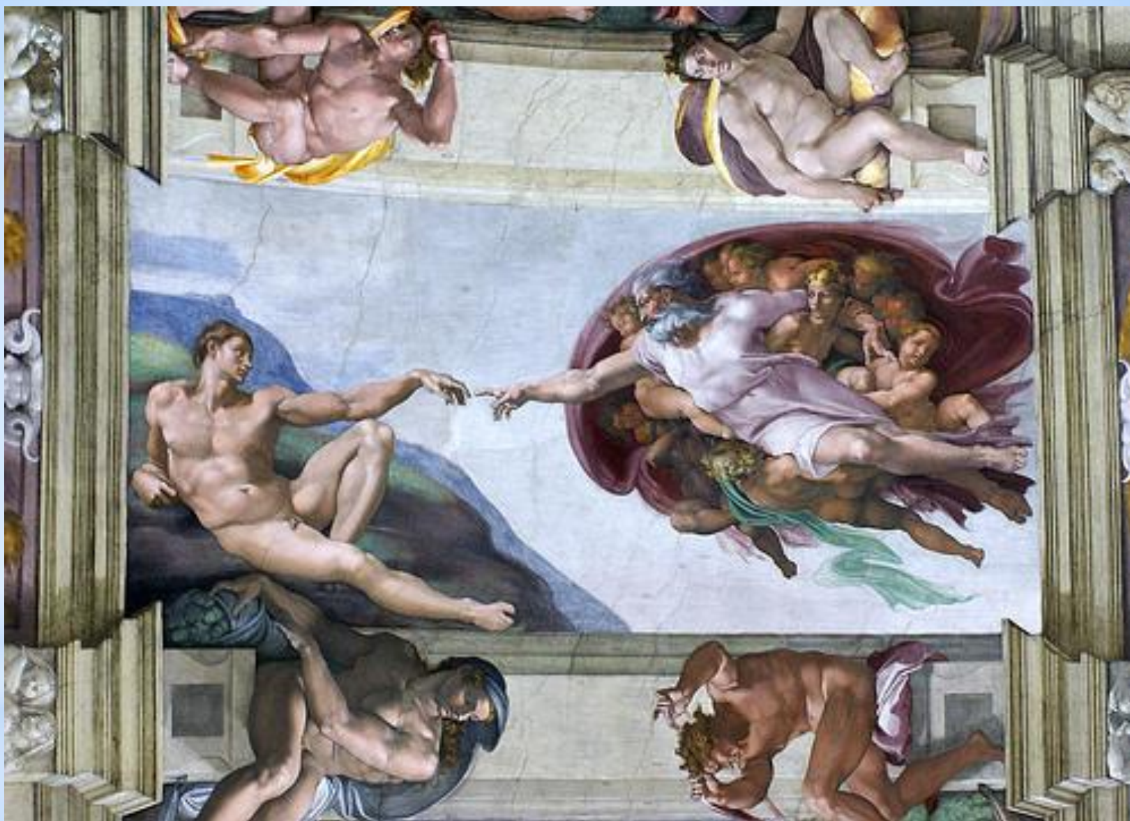
Skapelsen av Adam