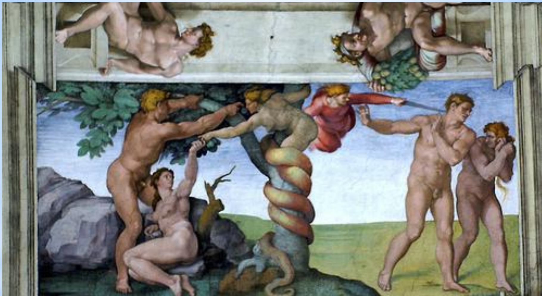
Fallet från edens lustgård